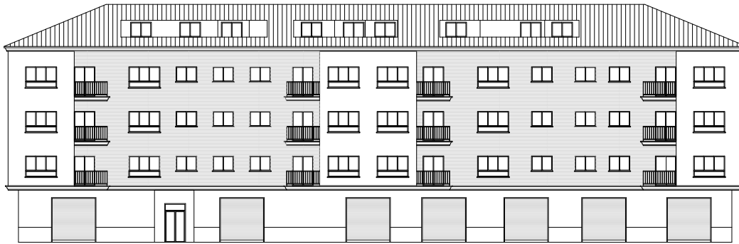
FACHADA Avda XUQUER