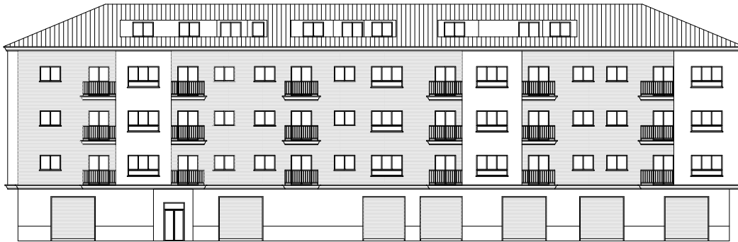
FACHADA C/ DE LA MARINA